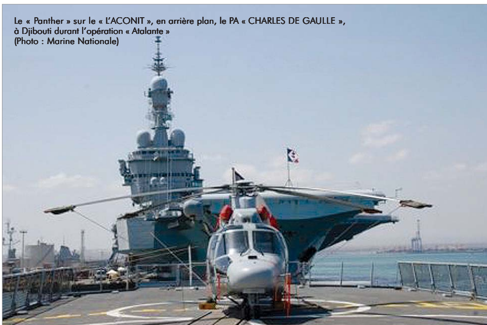
Le « Panther » sur le « L'ACONIT », en arrière plan, le PA « CHARLES DE GAULLE », à Djibouti durant l'opération « Atalante »